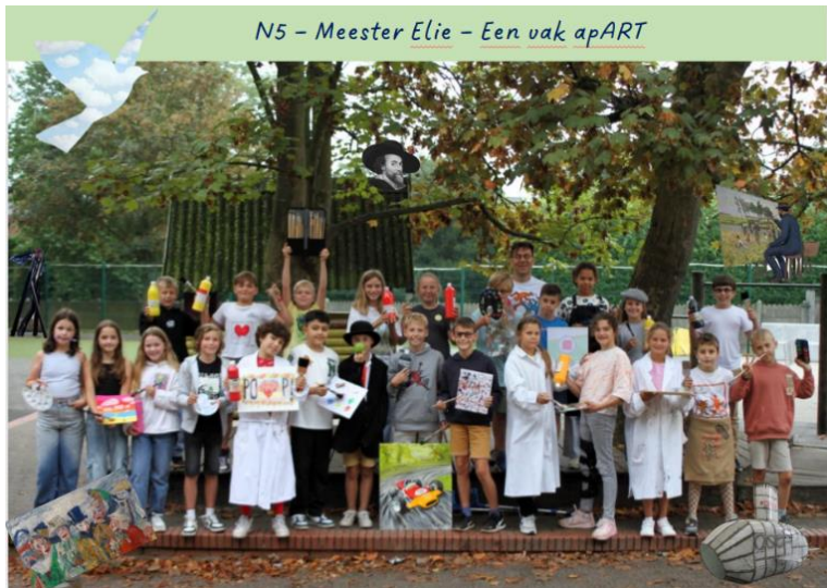
N5 - Meester Elie - Een vak apART

Elk jaar is er op school een overkoepelend thema. Dit jaar hebben we gekozen voor België en gedurende het schooljaar zullen er tal van activiteiten plaatsvinden. Je kan ons thema al bezichtigen op onze kalender.